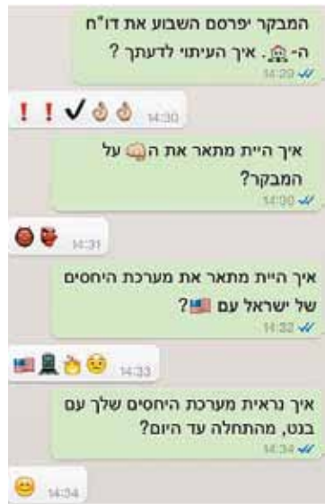
“הדבר האידיוטי ביותר שפורסם בעיתונות הישראלית”. ריאיון אימוג'י ב-ynet

עוד משהו: מפעיל בלוג מצליח בשם ‘מאבד תמלילים’